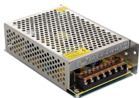
Alimentatori Strip LED ALIMENTATORE max100W 12/6A 24V IP20 Cod: 6360874