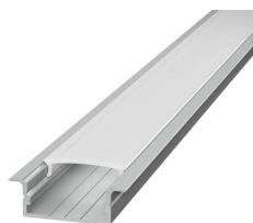
Kit montaggio Strip LED PROFILO DA INCASSO 2m IP20 Cod: 6360841